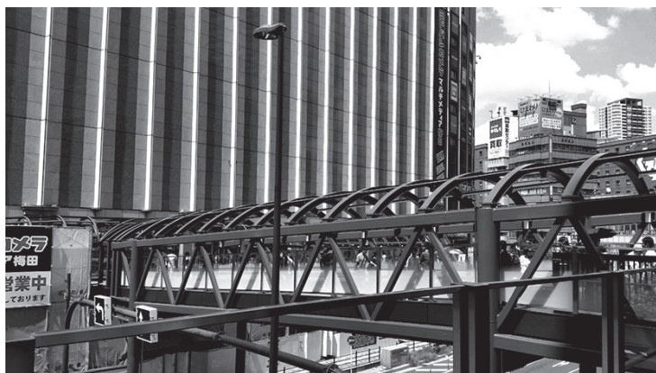
Fig.ex1 多くの利用者で賑わう淀橋

長らく「目の前に見えていのに辿り着けない」ことで有名なうめだヨドバシ梅田でしたが、2017年6月末にカリヨン広場とヨドバシ梅田2階入口を結ぶ待望の陸橋が架けられました。これによりJR大阪駅から地上2階経由でアクセスできるようになり、JRエリアの行き来がより便利になりました(背面地図参照)。 2017年5月から頒布した「うめだ迷路帖」についても、次の通り修正が入ります。ご利用の際は適宜読み替えをお願いします。